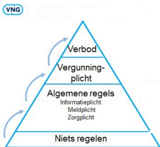
Afbeelding 3: Regel Piramide