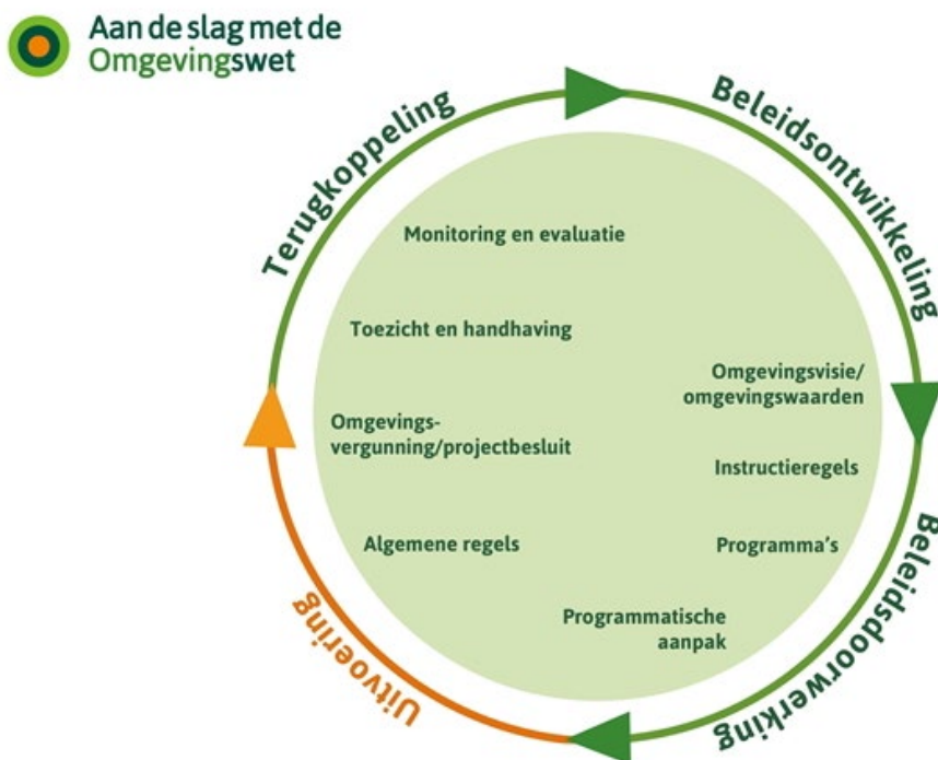
Afbeelding 2: Beleidscyclus

Het proces van tot stand komen van het Omgevingsplan, en daarmee van het overnemen, schrappen of wijzigen van de bruidsschatregels is een cyclisch proces.