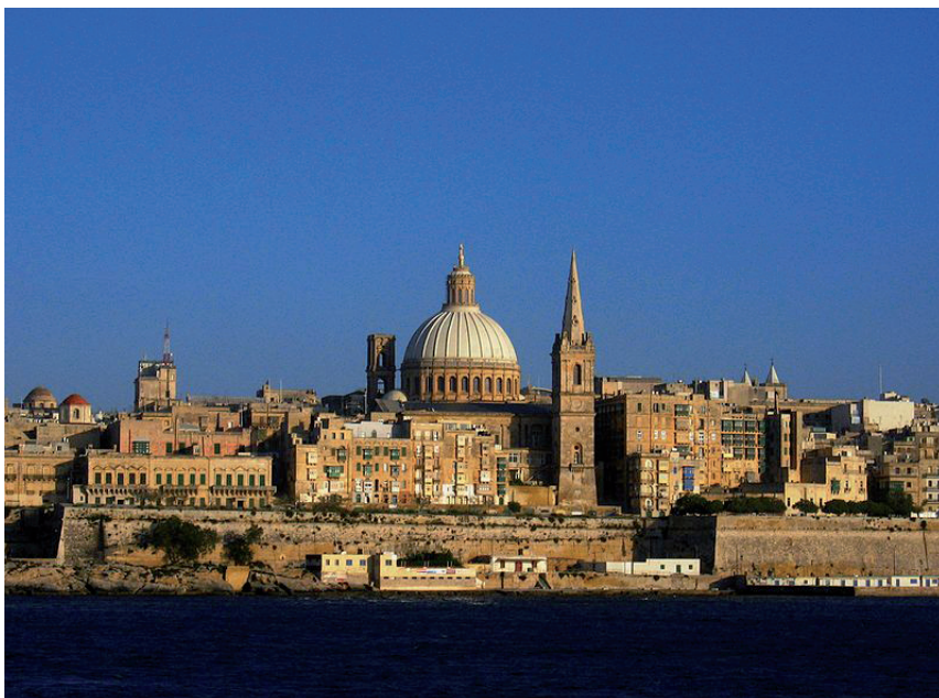
Figuur 2. In de hoofdstad Valletta (Malta) werd in 1993 door landen aangesloten bij de Raad van Europa de Conventie ter bescherming van het Europese archeologische erfgoed ondertekend.

Het Europese verdrag betreffende de bescherming van het archeologische erfgoed is in 1992 in Valletta (Malta; figuur 2) ondertekend door de ministers van Cultuur van de landen aangesloten bij de Raad van Europa. Dit verdrag wordt ook wel het Verdrag van Malta genoemd. Het Verdrag van Malta heeft als doel archeologische resten in Europa te beschermen als onvervangbaar onderdeel van het culturele erfgoed (artikel 1). Het accent ligt op het streven naar het behoud en beheer van archeologische resten in de bodem en op het zoveel mogelijk beperken van (de noodzaak van) archeologische opgravingen (artikel 2). Het verdrag bepaalt dat archeologie voortaan expliciet bij de besluitvorming over ruimtelijke ingrepen moet worden meegewogen. Waar mogelijk dienen de archeologische resten te worden ontzien (behoud in situ ). Wanneer bescherming en inpassing van archeologisch waardevolle terreinen niet mogelijk blijkt, zal de historische informatie door middel van archeologisch onderzoek moeten worden veiliggesteld (behoud ex situ ). Om deze doelstelling te bereiken, moet het archeologische belang volledig erkend worden in planologische besluitvormingsprocessen (artikel 5).