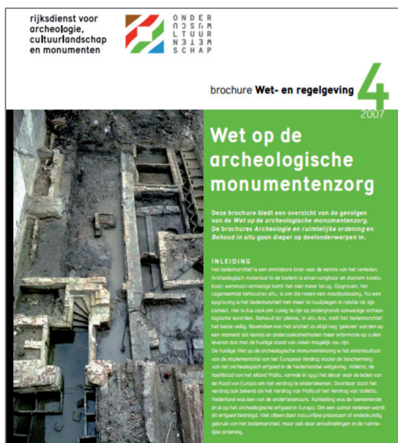
Figuur 3. Brochure van de Rijksdienst voor Archeologie, Cultuurlandschap en Monumenten ter introductie van de in 2007 tot stand gekomen Wet op de Archeologische Monumentenzorg.

Sinds september 2007 is de Wamz van kracht, waarin concreet invulling is gegeven aan het Verdrag van Malta. Het betreft onder meer een herziening van de Monumentenwet 1988 en sluit daarom zoveel mogelijk aan op bestaande wet- en regelgeving (figuur 3).