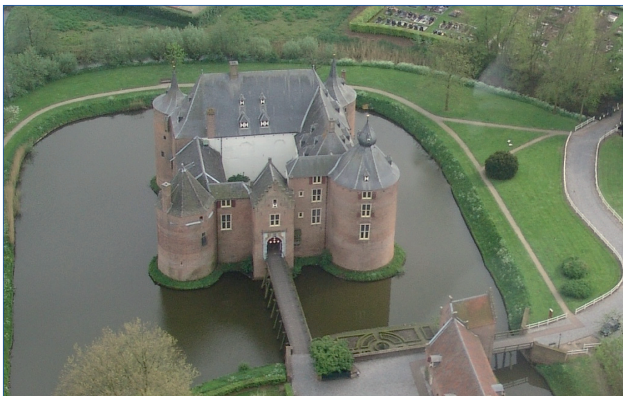
Figuur 7. Luchtfoto van kasteel Ammersooijen. Het kasteel is een rijksmonument.

In gebieden met een globale archeologische verwachting, waarvoor slechts op hoofdlijnen aangegeven kan worden welke archeologische resten aanwezig kunnen zijn, is het doorgaans niet mogelijk om een onderzoeksmethode te kiezen die naadloos aansluit bij het karakter van de aanwezige archeologische resten. Wanneer de archeologische verwachting niet voldoende gespecificeerd kan worden om een onderzoeksmethode en intensiteit op maat te kunnen bepalen, zal gekozen moeten worden voor een methode met een acceptabele opsporingkans voor een breed scala aan vindplaatstypen. Om archeologische resten te kunnen opsporen, wordt daarom gebruik gemaakt van relatief goedkope standaardonderzoeksmethoden (bureau- en/of booronderzoek, proefsleuven) die gericht zijn op het steekproefsgewijs verzamelen van informatie met betrekking tot de aan- of afwezigheid van archeologische resten en hun landschappelijke context. Bij dergelijke onderzoeken is het een voorwaarde dat het aantal waarnemingen voldoende groot is en een dusdanige spreiding kent dat het mogelijk is om (via ruimtelijke analyse) tot een interpretatie van de onderzoeksresultaten en tot een waardestelling van de aangetroffen archeologische resten te komen.