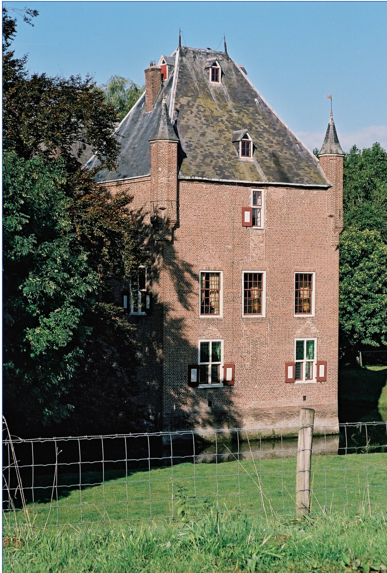
Figuur 8. Slot van Well of Huis van Malsen.

Onder deze categorie vallen kasteel Hedel, kasteel Ammersoyen (figuur 7), slot Well (figuur 8) en klooster Rossum. 3 Deze terreinen hebben een zeer hoge archeologische waarde; op basis van de Kwaliteitsnorm Nederlandse Archeologie (KNA) scoren deze terreinen zeer hoog als het gaat om zichtbaarheid en belevingswaarde. Minimale en ondiepe verstoring rondom deze objecten kan al gemakkelijk het bodemarchief verstoren c.q. vernietigen. De vondsten kunnen hier al op zeer geringe diepte aanwezig zijn. De gemeente Maasdriel wordt daarom geadviseerd voor deze terreinen als uitgangspunt te nemen dat bij ingrepen dieper dan 10 cm -Mv en groter dan 5 m 2 archeologisch onderzoek verplicht is. Behoud in situ van deze terreinen staat voorop. Ingrepen die kunnen leiden tot verstoring of vernietiging van de archeologische resten binnen deze terreinen dienen in principe te worden voorkomen. Alleen zeer kleine én ondiepe ingrepen zijn vergunningvrij.