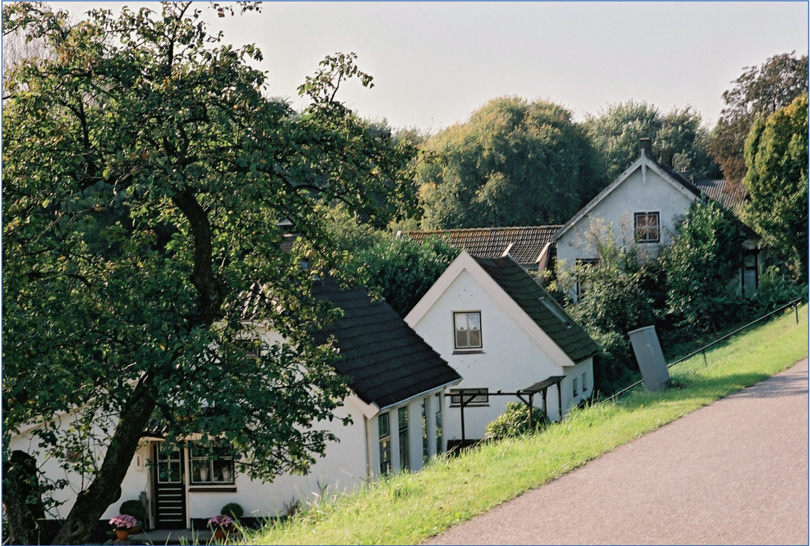
Figuur 9. Maasdriel kent ook veel cultuurhistorie. Hier enkele karakteristieke dijkwoningen.

Deel 2: 'Aantrekkelijk verleden tussen de rivieren': archeologiebeleid gemeente Maasdriel 2013-2016