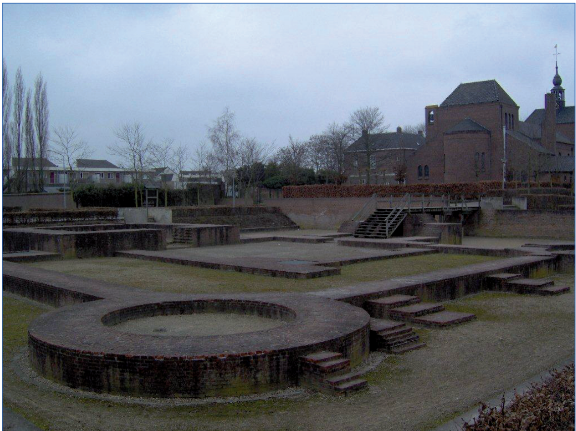
Figuur 1. "Van het eertijds belangrijke, doch in het eerste kwart der 19e eeuw afgebroken Slot te Hedel is het omgrachte kasteelemplacement, waarop thans de R.K. Kerk staat, overgebleven" (bron: Rijksdienst voor het Cultureel Erfgoed; bron foto: Wikimedia).

Archeologiebeleid van een gemeente omvat verschillende componenten. Het eerste deel betreft de inbedding in de ruimtelijke ordening (hoofdstuk 4). De gemeente Maasdriel is daarnaast bevoegd gezag en stelt bijvoorbeeld de eisen vast waaraan onderzoek moet voldoen en beoordeelt het uitgevoerde onderzoek (hoofdstuk 5). Bij nieuw beleid is het ook goed om stil te staan bij de organisatorische aspecten (hoofdstuk 6). De financiële aspecten van archeologiebeleid komen aan de orde in hoofdstuk 7. De concrete beslispunten die uit deze nota voortvloeien, zijn te lezen aan het eind van de nota in hoofdstuk 8. Alvorens in te gaan op de verschillende onderdelen van het gemeentelijk archeologiebeleid volgt in hoofdstuk 2 eerst een duiding van het wettelijke kader op basis waarvan de gemeente Maasdriel haar archeologiebeleid opstelt. In het daarna volgende hoofdstuk 3 staan de verschillende bevoegdheden van het Rijk, provincie en gemeenten beschreven. Voorbeeldplanregels voor de gemeente Maasdriel zijn verwoord in bijlage 1. Een uitgebreide toelichting op het wettelijke kader en het beleidskader is te lezen in de bijlagen 2 en 3.