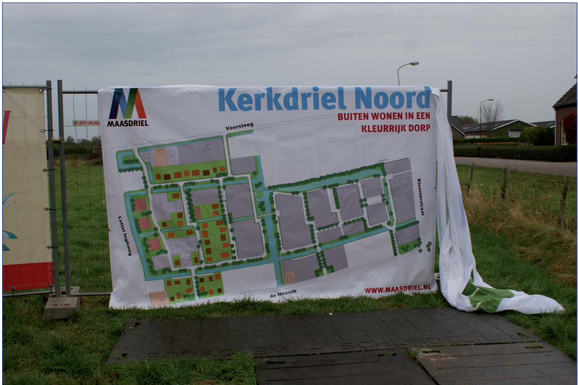
Figuur 4. Archeologisch (voor-)onderzoek maakt straks ook deel uit van het ruimtelijke ordeningsproces in Maasdriel.