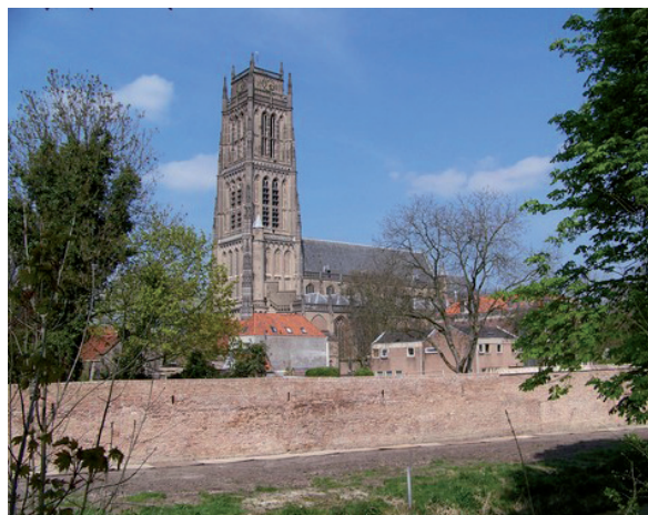
Figuur 5. Deel van de stadsmuur van Zaltbommel.