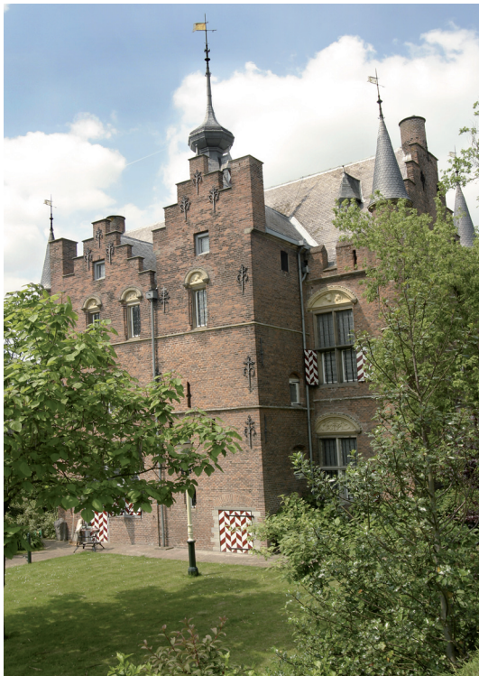
Figuur 4. Maarten van Rossumhuis (achterkant).

De binnenstad van Zaltbommel is nog steeds omsloten door een gaaf verdedigingstelsel, bestaande uit een 14e-eeuwse bakstenen stadsmuur met nog een poort, de Waterpoort, aan de noordzijde. De muur met gracht werd in de vroege 16e eeuw aangevuld met een binnenwal met een grotendeels verdwenen keermuur en vervolgens met een buitenwal met buitengracht. De bijbehorende rondelen zouden rond 1600 worden veranderd in bastions, maar zijn waarschijnlijk in