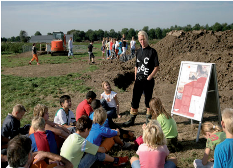
Figuur 7. Uitleg aan schoolkinderen tijdens opgravingen in het plangebied De Wildeman.

Behoud van cultuurhistorische objecten en elementen is van belang voor het grote publiek. Zonder de draagkracht en interesse van dat publiek zal de archeologische monumentenzorg en de zorg voor cultuurhistorie in brede zin, de zorg van slechts enkele zijn en blijven. Het is dan ook van belang dat een breed draagvlak voor archeologie wordt verkregen. Het is daarbij zinnig ons niet alleen op plannersmakers te richten maar ook op bewoners, scholieren en bezoekers (figuur 7).