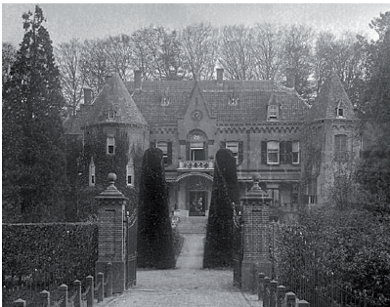
Figuur 1. Kasteel Nederhemert in 1918.

De gemeente Zaltbommel is een gemeente met een rijk verleden. Dat verleden is bijzonder herkenbaar: de toren van de Sint Maartenskerk is een waar 'landmark' in de Bommelerwaard, het kasteel van Nederhemert (figuur 1) is niet minder imposant evenals de delen van de Hollandse Waterlinie op het grondgebied van de gemeente Zaltbommel zoals bijvoorbeeld de batterijen bij Brakel en Poederoijen (figuur 2).