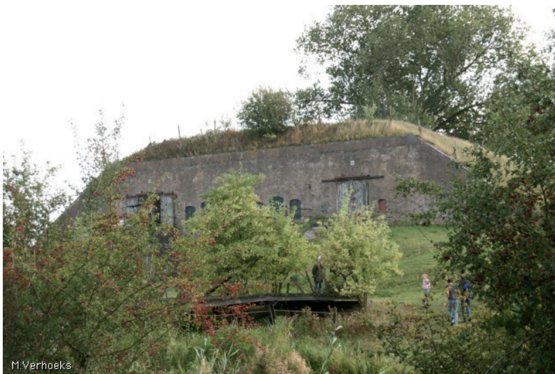
Figuur 2. Batterij bij Poederoijen, onderdeel van de NHW.