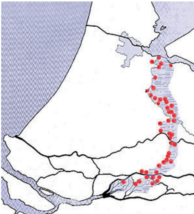
Figuur 3. Overzicht van de Nieuwe Hollandse waterlinie.

Evident is dat de Bommelse waterlinie behoort tot de natste delen van de NHW. Door de nabijheid van de rivieren Waal en Maas en de nog zo prominent aanwezige polderstructuur besef je meer dan waar ook dat het water en niet het stelsel van forten/batterijen de hoofdrol speelde in de verdediging, een waterlinie pur sang dus. De Bommelse Nieuwe Hollandse Waterliniestructuur vormt dan ook een van de gaafste en meest sprekende delen van de waterlinie, van een rijksmonument dat binnenkort wellicht ook UNESCO-erfgoed is. Heel bijzonder is ook dat in de Bommelerwaard de waterliniestructuur zo vervlochten is met de fascinerende middeleeuwse structuur van waterbeheersing, van de strijd tegen het water, en met het nog zo wonderlijk gave landschap van de ruilverkavelingen (figuur 3).