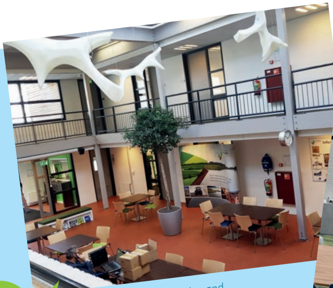
De hal van het oude pand

Wij moeten met zijn allen blijven investeren in een betere leefomgeving zodat mede door onze inspanningen het leefmilieu beter wordt.